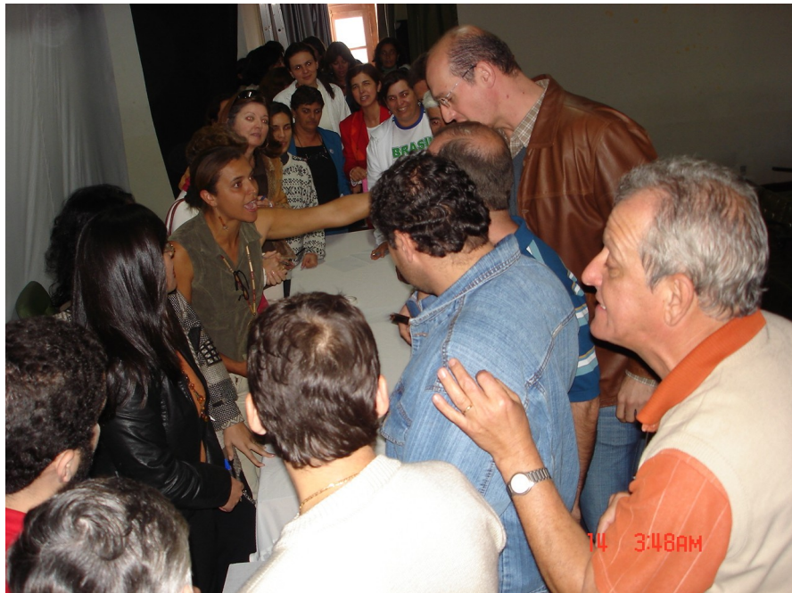
Figura 1.1 – Reunião inicial da elaboração do PDI com a comunidade acadêmica da EAFB. Palestra.