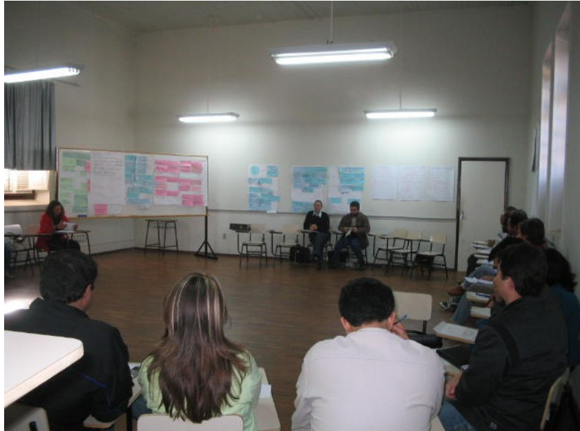
Figura 1.3- Vista parcial de uma das sessões de prática metodológica do Diagnóstico Participativo – FOFA